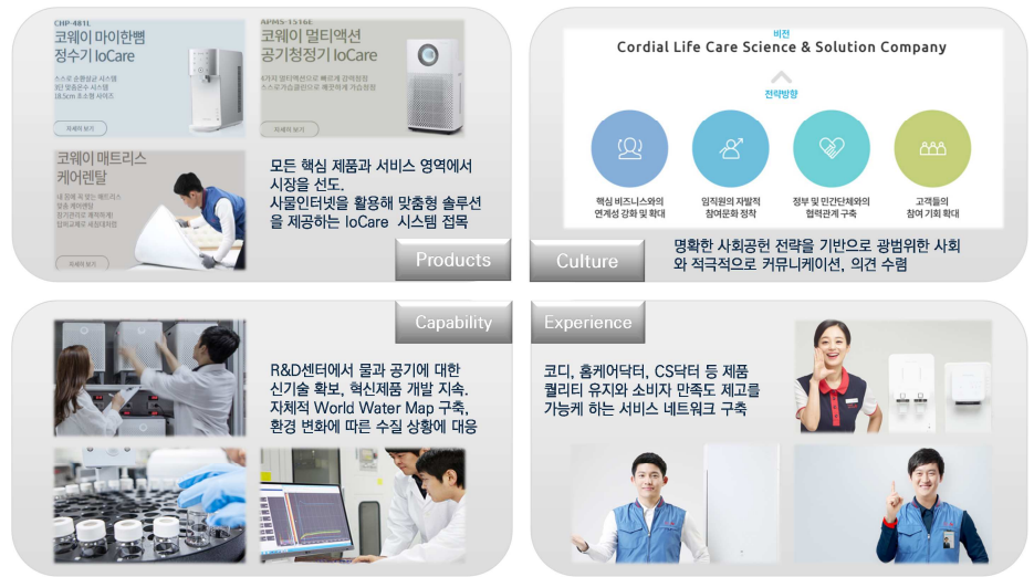
그림 1. 브랜드와 기업가치가 유기적으로 연계된 하드웨어/소프트웨어 체계 구축