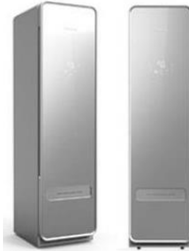
도표 4 2018 CES 혁신상을 수상한 코웨이 의류청정기 FWSS